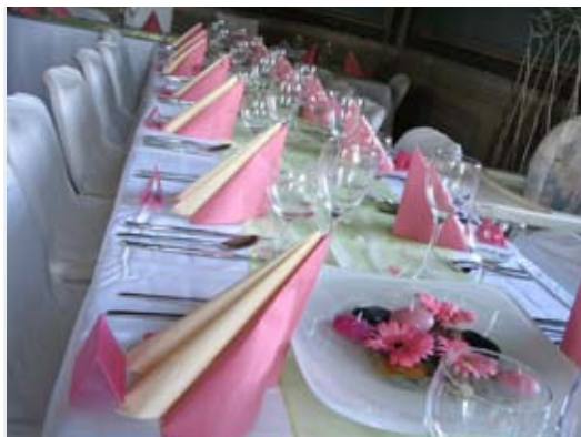
svatba v restauraci Zámecký had pro 20 osob