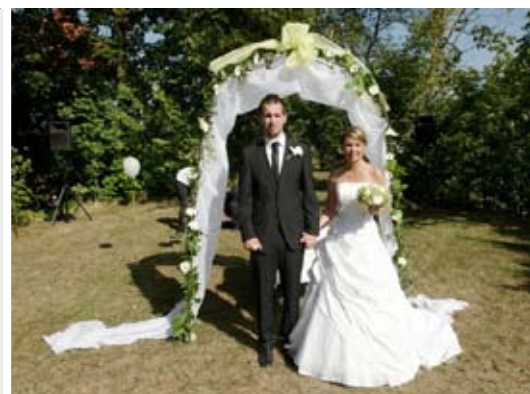
Obřad pod zámekem u řeky