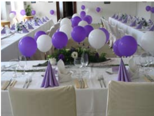
svatba ve velkém zámecké sále 60 osob