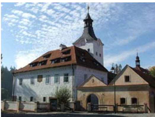
Dobřichovický zámek, pohled z náměstí