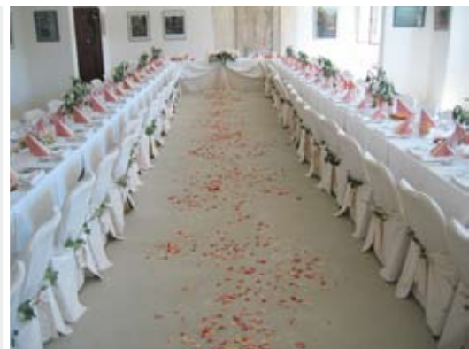
svatba ve velkém zámecké sále 90 osob