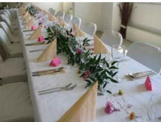
svatba ve velkém zámecké sále 48 osob