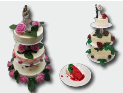
třípatrový cheese cake s čerstvými růžemi