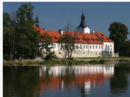
Dobřichovický zámek a prostor u řeky