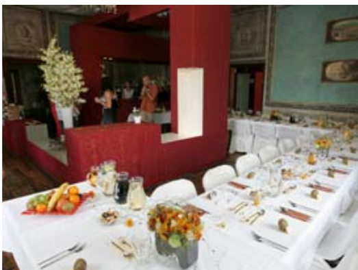
svatba v restauraci Zámecký had pro 24 osob