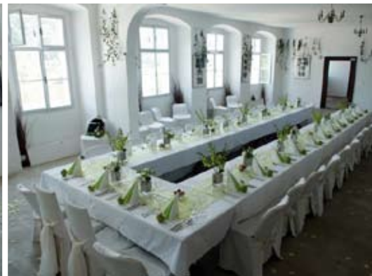
svatba ve velkém zámecké sále 50 osob