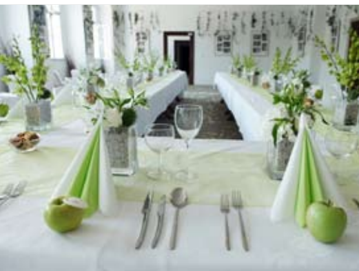
svatba ve velkém zámecké sále 40 osob