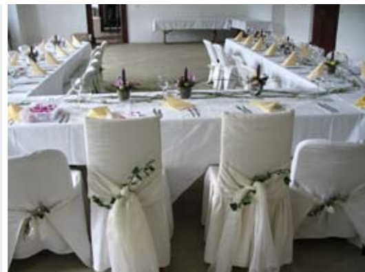
svatba ve velkém zámecké sále 28 osob