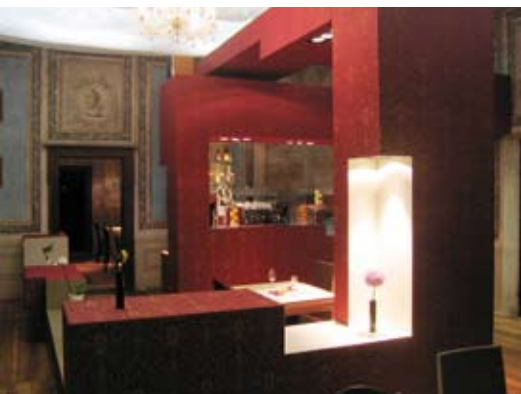
interier restaurace Zámecký had