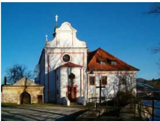
Dobřichovický kostel v zadním traktu zámku